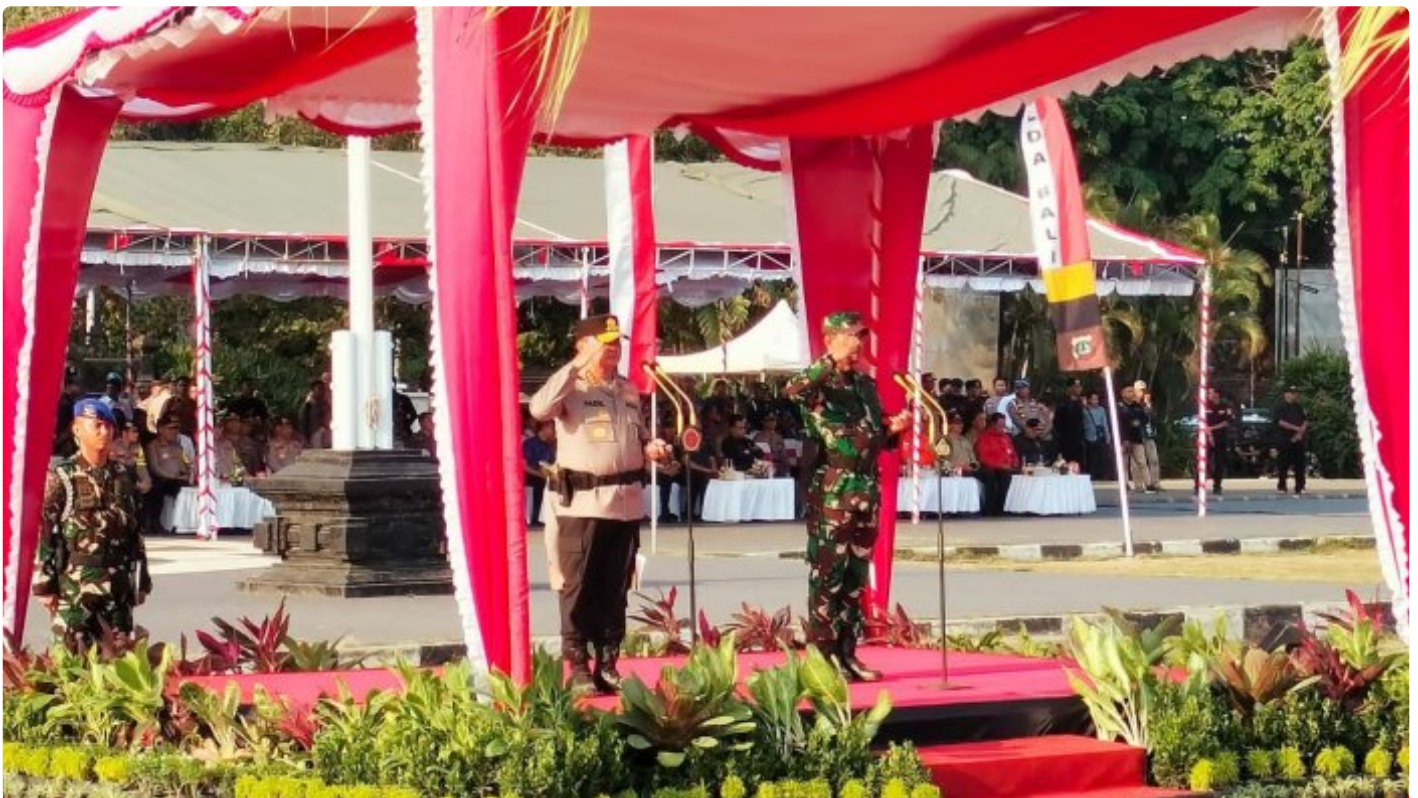
Sinergitas TNI-POLRI dan Masyarakat Bali

ALI - Polri bersama TNI telah menyiapkan pengamanan penyelenggaraan Konferensi Tingkat Tinggi (KTT) Archipelagic and Island State (AIS) Forum 2023 yang akan digelar di Bali pada 10-11 Oktober 2023.