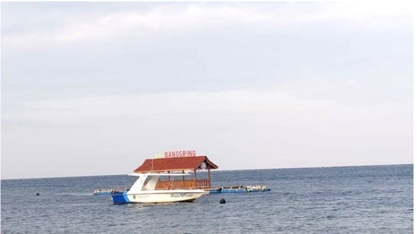
Wisata bahari rumah apung bangsring di perairan selat Bali

BANYUWANGI - Kabupaten Banyuwangi, Jawa Timur, selalu menjadi magnet bagi para pencinta alam dan keindahan laut. Di ujung timur Pulau Jawa ini, kekayaan bawah lautnya menjadi sumber potensi wisata yang tak ada habisnya.